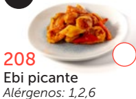
208 Ebi picante Alérgenos: 1,2,6