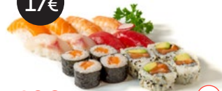
192 Sushi medio Alérgenos: 2,4,11,15