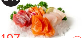
197 Sashimi mixto Alérgenos: 4