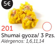
201 Shumai gyoza/ 3 Pzs. Alérgenos: 1,6,11,14