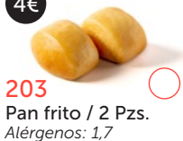
203 Pan frito / 2 Pzs. Alérgenos: 1,7