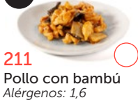
211 Pollo con bambú Alérgenos: 1,6