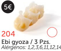
204 Ebi gyoza / 3 Pzs. Alérgenos: 1,2,3,6,11,12,14