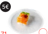
5€ 71 Chirashi salmón Alérgenos: 4,15