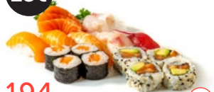
194 Barca Alérgenos: 2,4,11,15