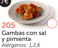
205 Gambas con sal y pimienta Alérgenos: 1,2,6