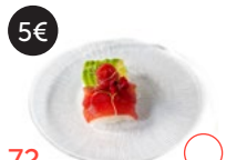
5€ 72 Chirashi tekka Alérgenos: 4,15