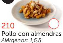
210 Pollo con almendras Alérgenos: 1,6,8