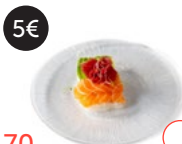
5€ 70 Chirashi mixto Alérgenos: 4,15