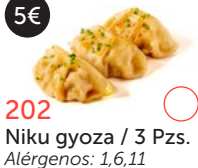
202 Niku gyoza / 3 Pzs. Alérgenos: 1,6,11