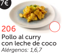
206 Pollo al curry con leche de coco Alérgenos: 1,6,7