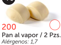
200 Pan al vapor / 2 Pzs. Alérgenos: 1,7