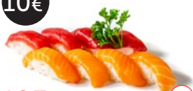
193 Sake maguro nigiri Alérgenos: 4