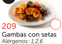
209 Gambas con setas Alérgenos: 1,2,6