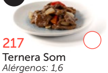
217 Ternera Som Alérgenos: 1,6